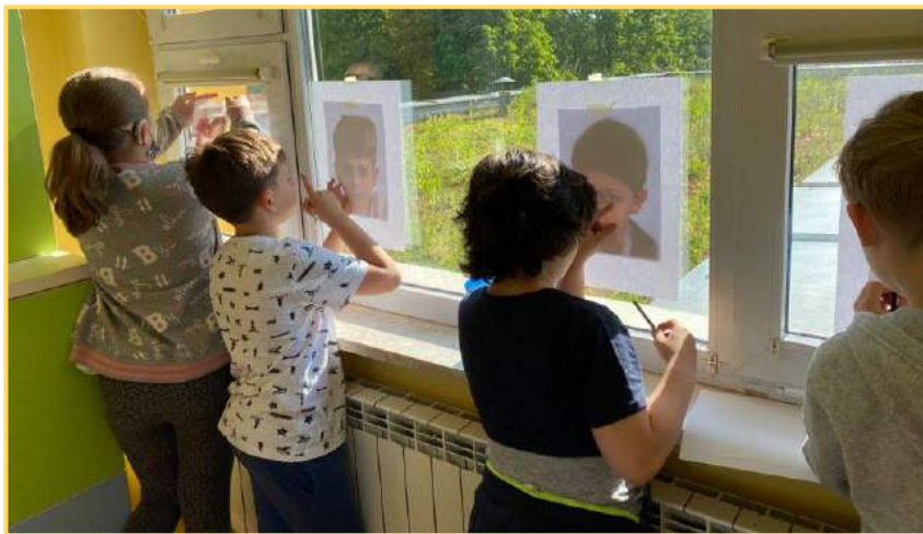
KALKA KREŚLARSKA, PRZEZROCZYTA

Kalkowanie to technika plastyczna, dzięki której w prosty sposób skopiujesz ciekawy obrazek z ulubionej książki. Można wykorzystać kalkę kreślarską, papier śniadaniowy lub zwykłą kartkę i słońce. Ten ostatni sposób wypróbowali uczniowie klasy 3a podczas przygotowywania swoich autoportretów.